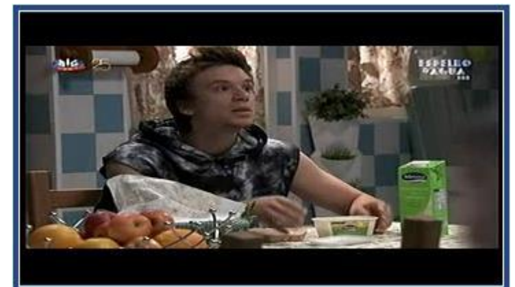
MIMOSA – ESPELHO D'ÁGUA (SIC)