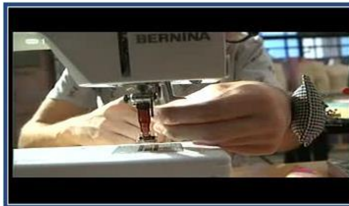
BERNINA – COSIDO À MÃO (RTP1)