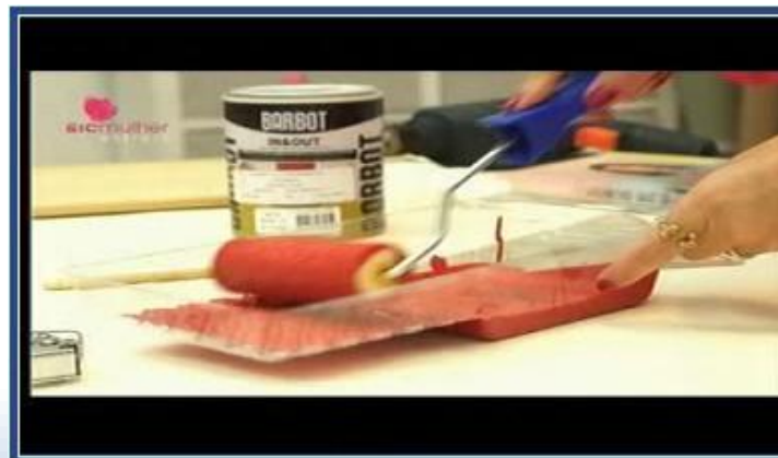
BARBOT – O MUNDO DE SOFIA (SIC MULHER)