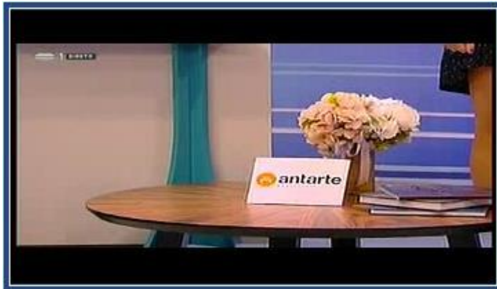
ANTARTE – PREÇO CERTO (RTP1)