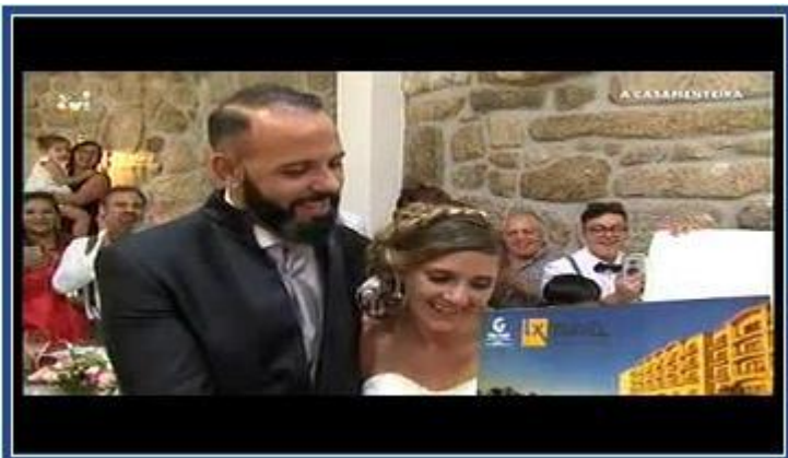
LX TRAVEL – A CASAMENTEIRA (TVI)