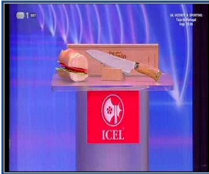
ICEL – O Preço Certo (RTP1)